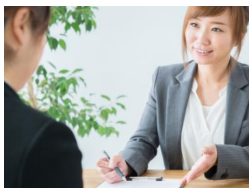
きめ細かな就職支援

パソコンの知識を習得し、簿記を学ぶことにより企業で即戦力としてのスキルを身につけられます。 資格取得率は90% を維持しています。